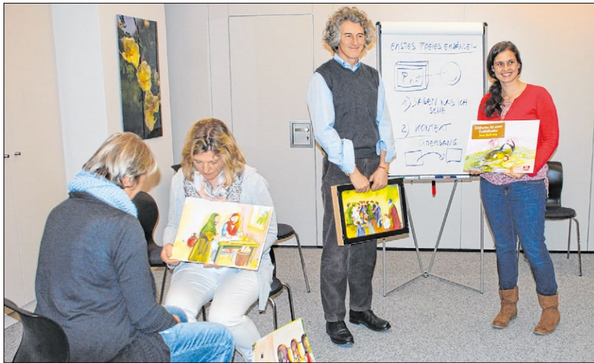
▲ Eine besondere Art des Erzählens: Mit dem Kamishibai werden Geschichten zum spirituellen Erlebnis.

Die Bilder sind eine Hilfe, mit denen sich der Erzähler einfacher auf seine Zuhörer einlassen und auf sie wirken kann. Dabei hat er die Zahl und die Abfolge der Bilder selbst in der Hand, im Gegensatz zu Bilderbüchern, wo auch die Kinder ein schnelleres Umblättern erwarten. „Der Schwerpunkt beim Kamishibai liegt darauf, dass man an einer Stelle verharrt und mit den Zuhörern überlegt, wie es weitergeht“, sagt Kober, der mit wissenschaftlichem Hinter-