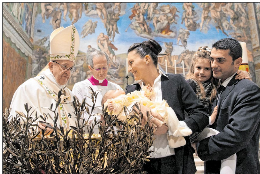
▲ Bei vielen Täuflingen waren auch die älteren Geschwister dabei.