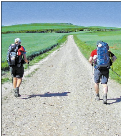
▲ Pilger auf dem Jakobsweg.