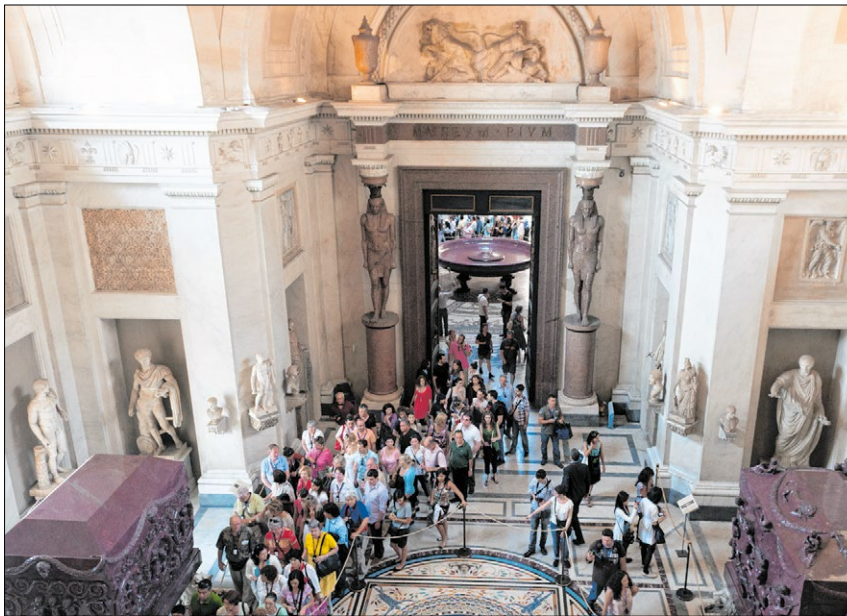
▲ Die Museen im Vatikan gehören zu den meistbesuchten der Welt.