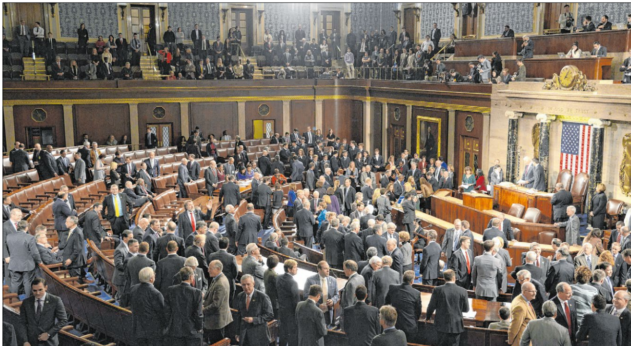
▲ Noch nie schafften es so viele Katholiken in den US-Kongress wie bei den zurückliegenden Wahlen. Sie stellen ein Drittel der Abgeordneten im Repräsentantenhaus und knapp ein Viertel der Senatoren.