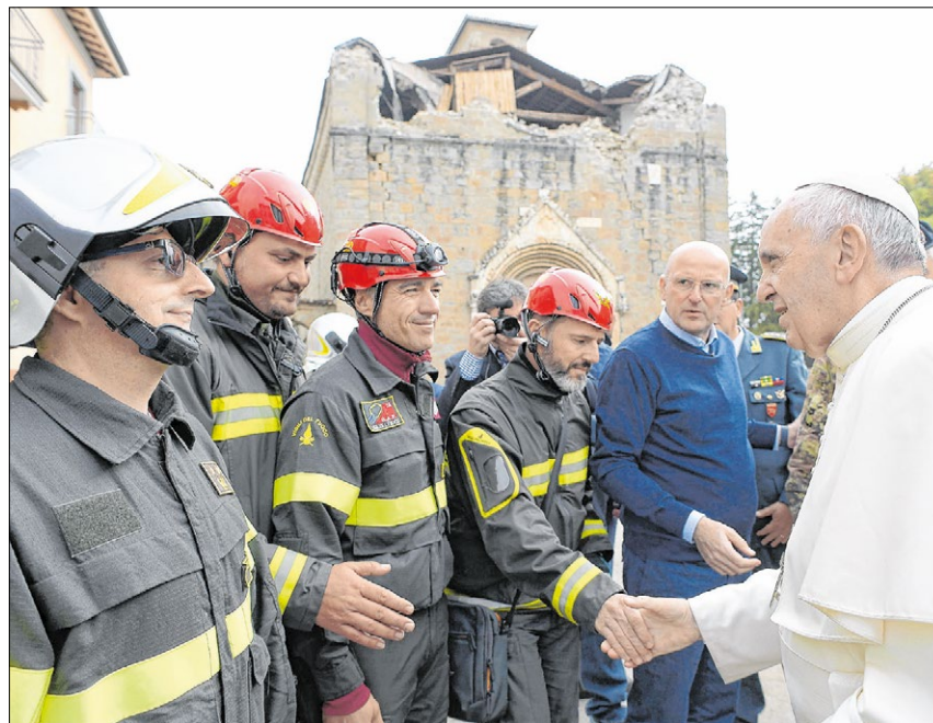
▲ Papst Franziskus hatte im Oktober das von Erdbeben zerstörte Amatrice besucht. Nun waren Betroffene aus verschiedenen Orten im Vatikan.