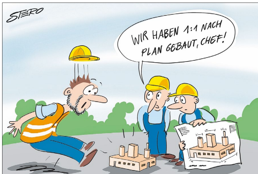
Illustration: Stefan Roth/Deike