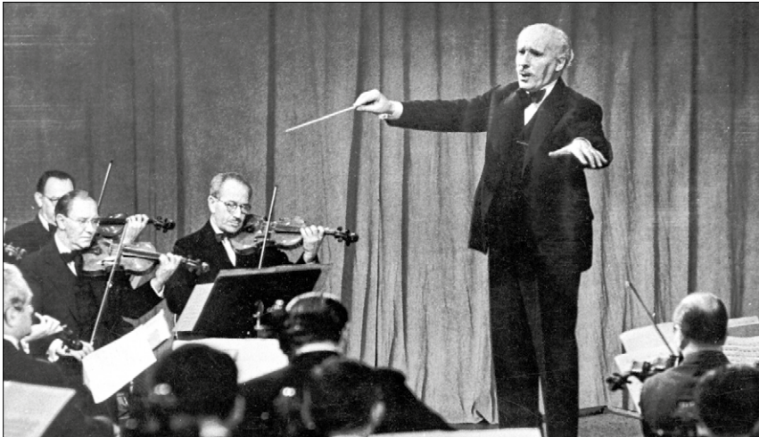
▲ Arturo Toscanini dirigiert das NBC-Sinfonieorchester.