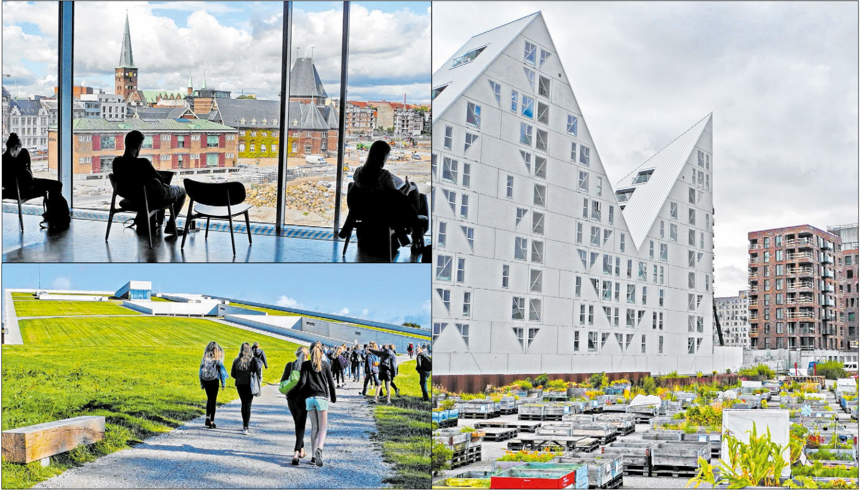
▲ Oben links: Im Gebäude Dokk1 lockt die Aussicht auf Aarhus vor allem Studenten an. Bei jungen Leuten sehr beliebt ist das Moesgaard Museum (links unten). Im Sommer wird auf seinem Dach vor 3500 Zuschauern das Wikinger-Epos „Röde Orm“ aufgeführt. Ein neues Wahrzeichen der Stadt ist der sogenannte Eisberg (rechts), eine Wohnanlage, die vier Architekturbüros gemeinsam konzipiert haben. Vor dem Gebäudekomplex ziehen die Bewohner in Holzkisten Blumen und Gemüse.