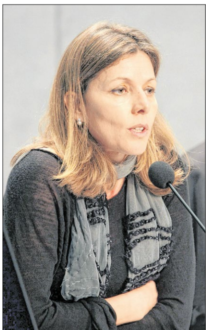
▲ Barbara Jatta leitet seit 1. Januar die Vatikanischen Museen. Sie ist die erste Frau auf diesem Posten.

Frau Jatta, Sie sind die erste Frau weltweit, die ein so großes Museum leitet. Die Vatikanischen Museen liegen bei den Besucherzahlen auf Platz drei der Welt. Sie können sich