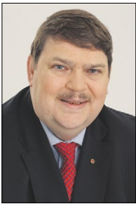
Bernd Posselt ist seit Jahrzehnten in der Europapolitik tätig und Sprecher der Sudetendeutschen Volksgruppe.

Das vor allem von der CSU protegierte Betreuungsgeld für Eltern, die für Kinder unter drei Jahren keinen Krippenplatz in Anspruch nehmen, wurde von Opposition, feministischen Verbänden und zahlreichen Medien als „Herdprämie“ diffamiert und 2015 als Bundesleistung wieder abgeschafft. Seit Juni 2016 kann es nur noch in Bayern bezogen werden. Es stellt mit 150 Euro monatlich aber keinen Ersatz für ein berufliches Einkommen dar und bietet somit – entgegen der Ansicht der Bayerischen Landesregierung – auch keine Wahlfreiheit. Diese ist nach wie vor ein Wunschtraum.