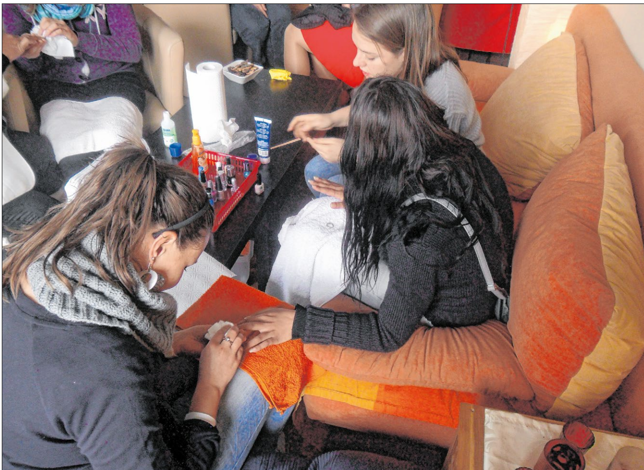
▲ Im Café Neustart können sich die zumeist jungen Prostituierten in entspannter Atmosphäre beraten lassen.

Näheres zum Café Neustart finden Sie im Internet: neustart-ev.de