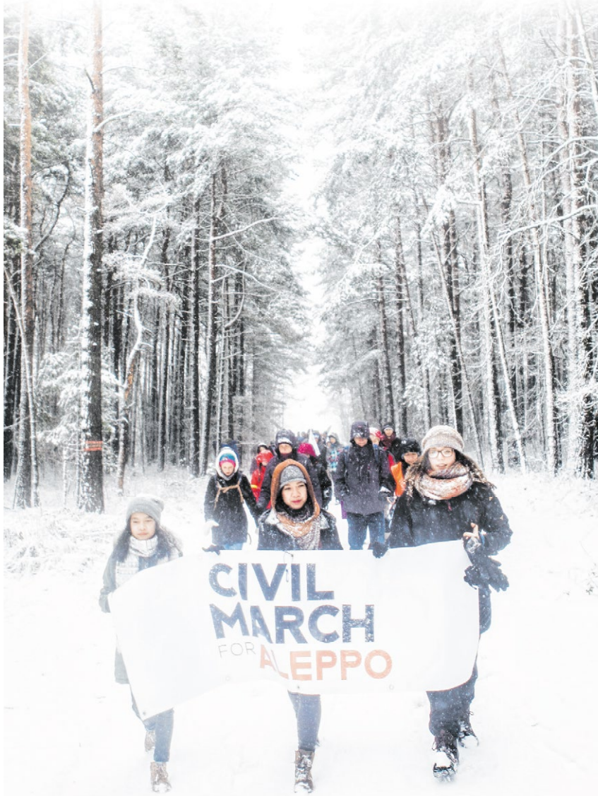
▲ Trotz Wind und Wetter: die Teilnehmer des Friedensmarschs für Syrien. Noch rund 3000 Kilometer liegen vor ihnen, bevor sie die zerbombte Bürgerkriegsstadt Aleppo (oben) erreichen.