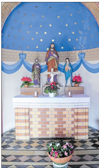
▶ Der Altar der Kapelle ist mit einer großen Jesusfigur geschmückt. Rechts und links stehen kleinere Figuren von Maria und Josef. „Pokoj budź z wami“ (Friede sei mit euch) stand früher als Schriftzug im Altarbogen.