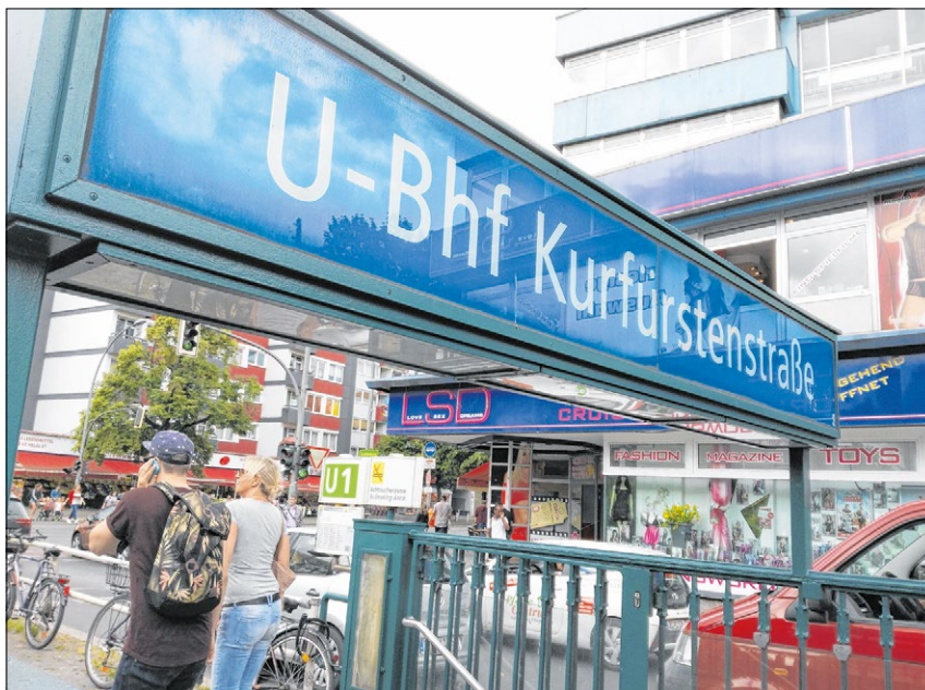
▲ Rund um die Berliner Kurfürstenstraße bieten Prostituierte ihre Dienste an. Der christliche Verein Neustart will ihnen helfen, aus dem Teufelskreis von Armut und „käuflicher Liebe“ auszubrechen.

spendablen Freier aufzuwachen oder wenigstens 20 bis 30 Euro verdient zu haben.