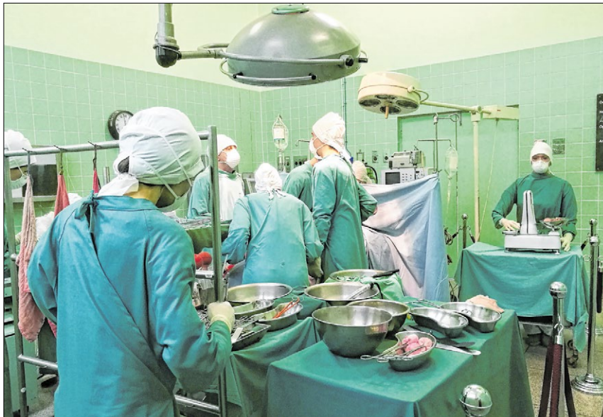
▲ Im „Heart of Cape Town“-Museum in Kapstadt ist die erste Herztransplantation durch Silikonfiguren nachgestellt.

Barnard trommelt seine Kollegen aus dem Bett. Um 0.45 Uhr werden die junge Denise Darvall und der