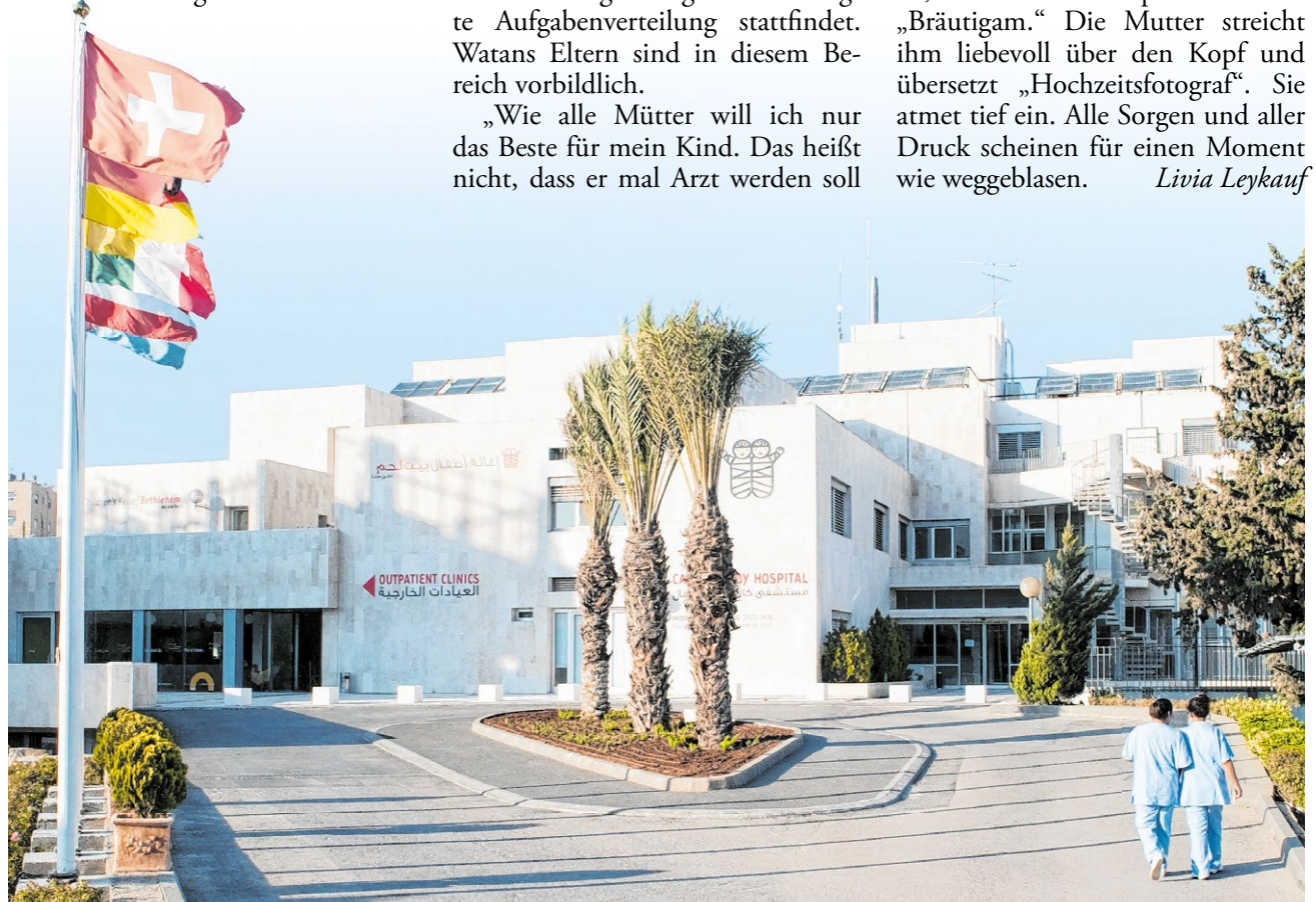
▲ Das Caritas Baby Hospital in Bethlehem behandelt im Jahr mehr als 46 000 Kinder aus dem Westjordanland. Die Klinik gilt als eine Oase der Genesung und des Friedens im Heiligen Land.

oder so. Ich hoffe einfach, dass er für sich selbst sorgen kann.“ Die junge Frau kämpft mit den Tränen, als sie von ihren Sorgen um Watan's Zukunft spricht. Um sich abzulenken, wendet sie sich an die Kinder und fragt: „Was wollt ihr später mal werden?“ Watan strahlt sie auf seine unvergleichlich charmante Art an, dreht kess den Kopf und erklärt: „Bräutigam.“ Die Mutter streicht ihm liebevoll über den Kopf und übersetzt „Hochzeitsfotograf“. Sie atmet tief ein. Alle Sorgen und aller Druck scheinen für einen Moment wie weggeblasen. Livia Leykauf