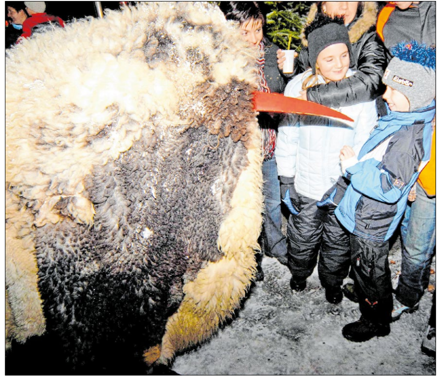
▲ Begleitet von wilden Krampussen zieht der heilige Thomas mit seinen Gefährten durch das Bergdorf Gams in der Steiermark (Bild links). Besonders beliebt bei den Kindern ist die „Thomashutzn“ (Bild rechts) – und das obwohl die Schnabelpercht laut Volksglaube die bösen Kinder mitnimmt.