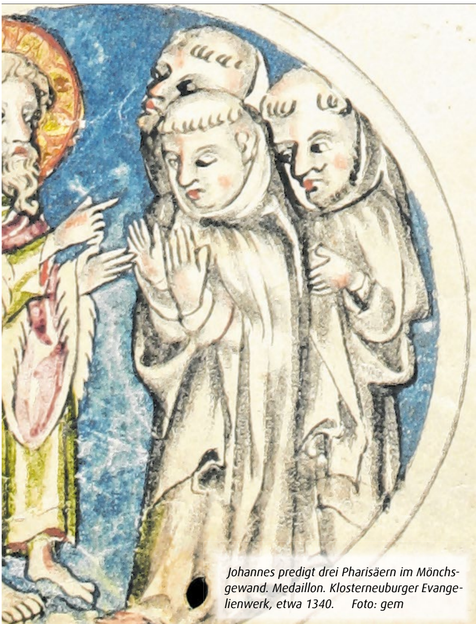
Johannes predigt drei Pharisäern im Mönchsgewand. Medaillon. Klosterneuburger Evangelienwerk, etwa 1340.