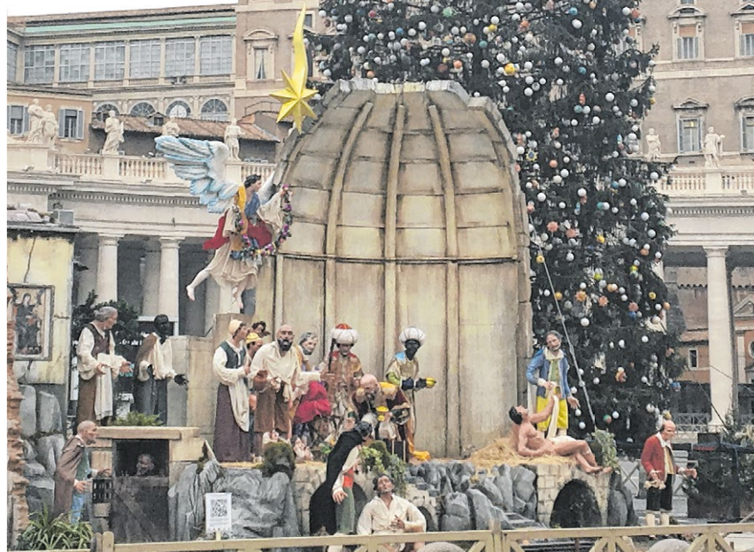
▲ Die Werke der Barmherzigkeit stehen dieses Jahr im Mittelpunkt der Weihnachtskrippe auf dem Petersplatz. Die mannshohen Figuren aus Süditalien sind vor der 30 Meter hohen Rottanne aus Polen platziert.

Es ist ein kalter aber immerhin trockener Donnerstagmittag auf dem Petersplatz: Gäste aus Polen und Neapel stehen Schlange, um Papst Franziskus zu besuchen. Sie sind aber nicht mit leeren Händen nach Rom gereist. Rund 2000 Kilometer hat das Geschenk aus Polen hinter sich: Die Rottanne ist fast 30 Meter hoch und hat einen Umfang von rund zehn Metern.