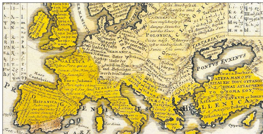
▲ Eine Europa-Karte (18. Jahrhundert) mit dem Vaterunser in zahlreichen Sprachen.