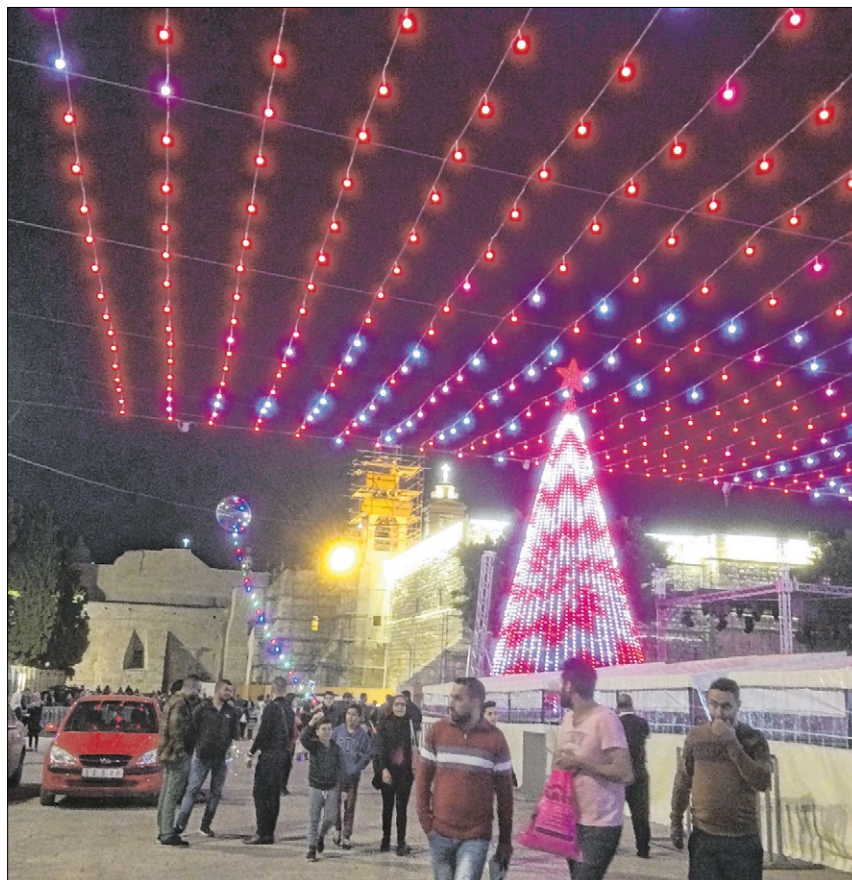
▲ Die adventliche Stimmung in Bethlehem endete jäh, als US-Präsident Donald Trump verkündete, Jerusalem ab sofort als Hauptstadt Israels zu betrachten. Alle Lichter erloschen.

Ausgerechnet in der Adventszeit führt die Ankündigung des US-Präsidenten zu einer gefährlichen Zuspitzung des Nahostkonflikts. Ausgerechnet kurz vor Weihnachten, dem Fest des Friedens. Jerusalem dürfe seines Friedens nicht beraubt