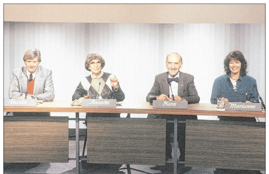
▲ Guido Baumann und seine Ratekollegen Annette von Aretin, Hans Sachs und Marianne Koch (von links) rätseln: „Was bin ich?“