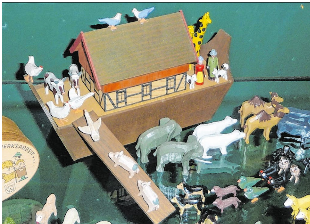
▲ Jeweils ein Männchen und ein Weibchen von jeder Tierart finden Zuflucht in der rettenden Arche Noah: Auch die Spielzeugbauer haben diese biblische Erzählung für sich entdeckt.

„Auch die DDR erkannte das Potential des kleinen Ortes“, erklärt Katja Rothamel, die im Erzgebirge aufgewachsen ist. 1973 ließen die Parteiobere das noch heute bestehende Spielzeugmuseum errichten, das dem Besucher einen Querschnitt durch 200 Jahre deutscher Spielzeuggeschichte bietet. Darunter befinden sich Motive wie die der Heiligen Drei Könige und der Arche