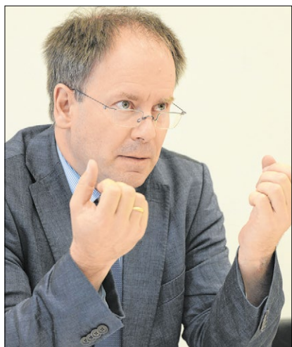
▲ Benedikt Kranemann.