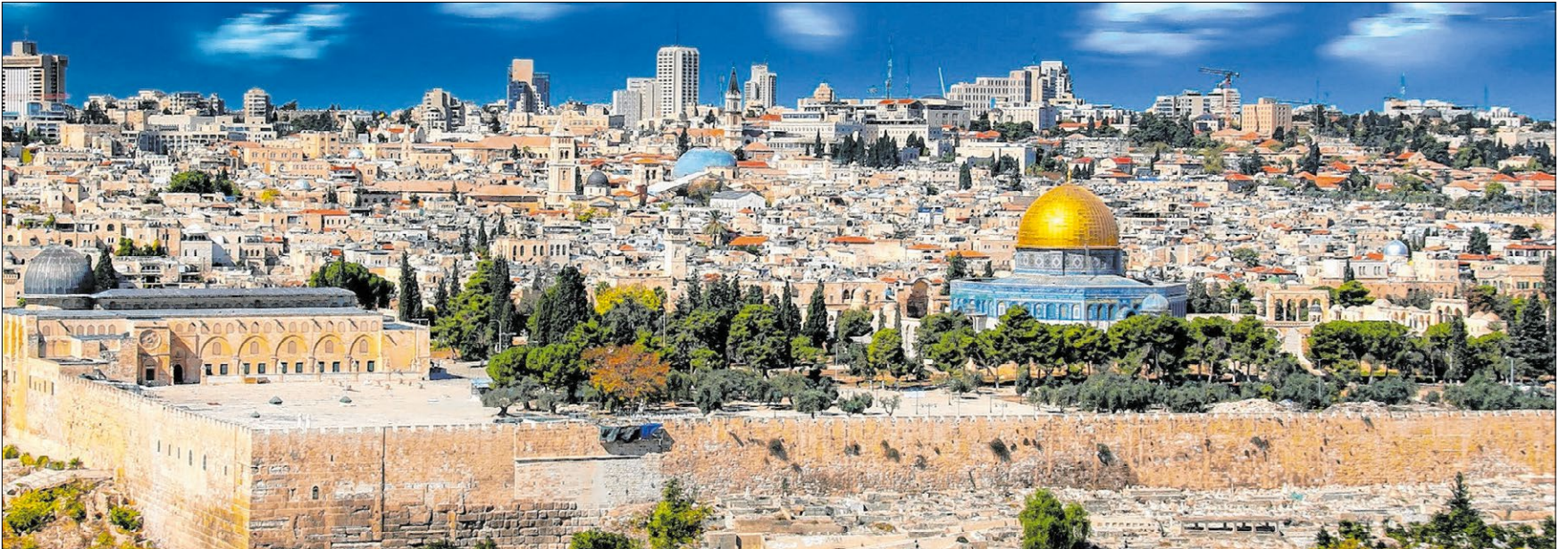
▲ Jerusalem: Heilige Stadt von drei Weltreligionen – und in den Augen von US-Präsident Donald Trump Hauptstadt Israels.