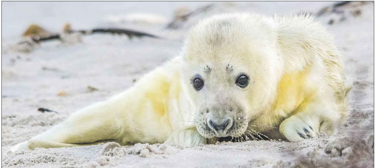
▲ So niedlich die kleinen Robbenbabys auch aussehen, sie sind keine Kuschtiere.

Diese geschützten Rückzugsorte der Kegelrobben sind besonders für