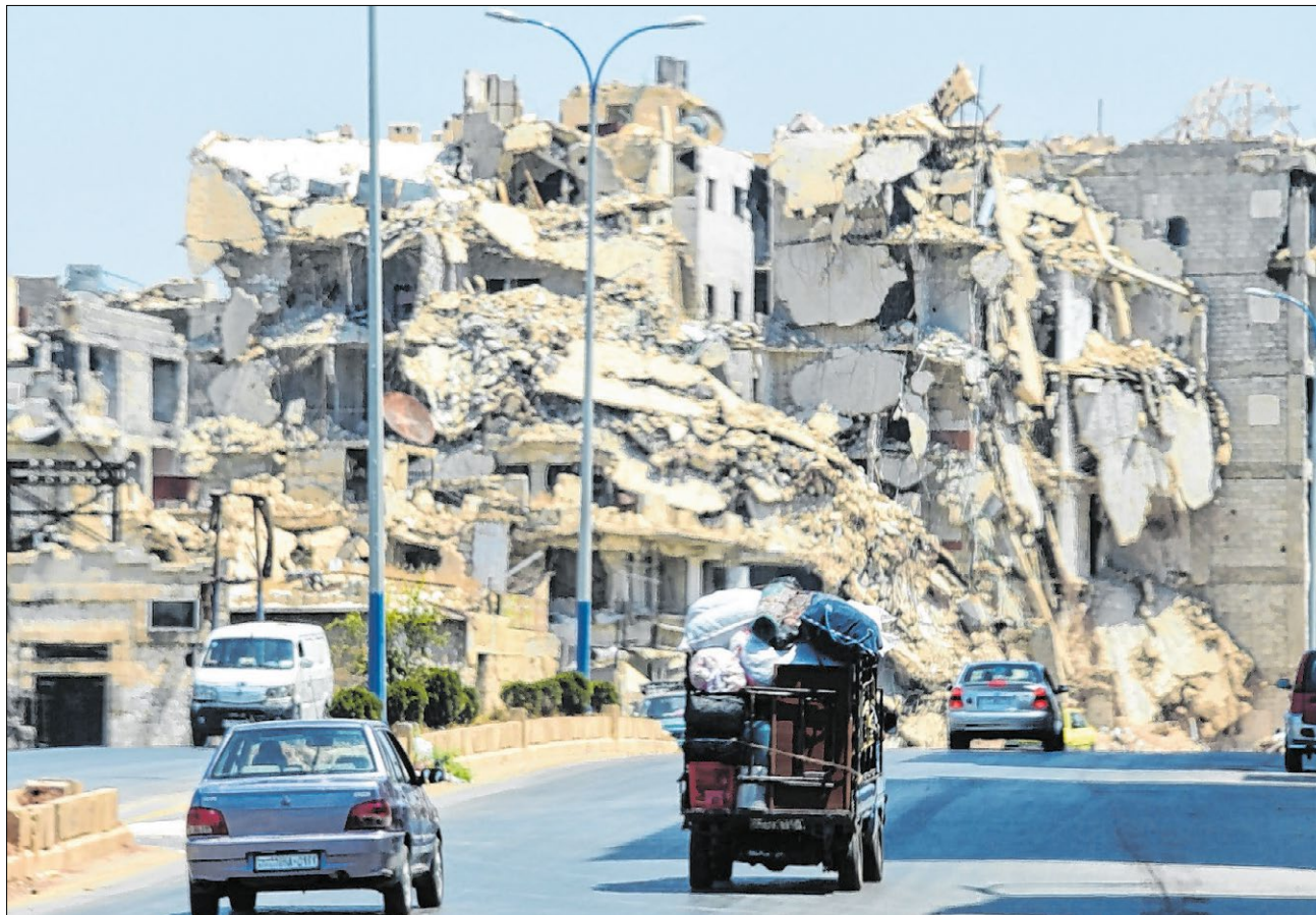
▲ Zerstörte Häuser in Aleppo. Die Menschen in Syrien leiden auch unter den europäischen Sanktionen.