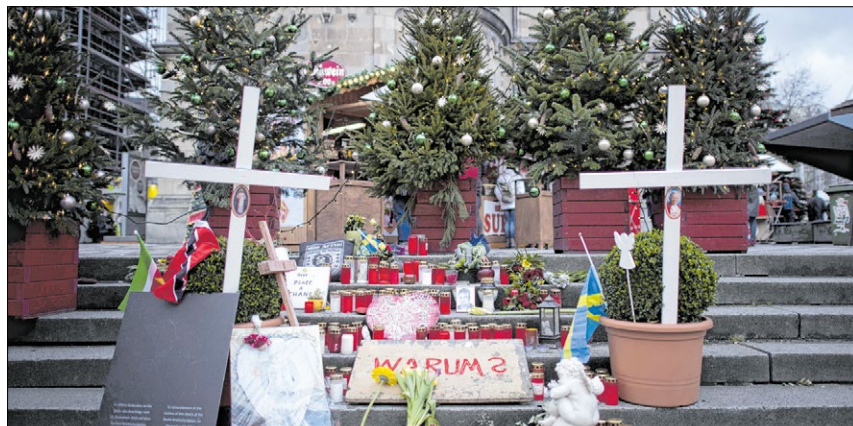
▲ Auch ein Jahr nach dem Terroranschlag am Berliner Breitscheidplatz herrschen Trauer und Fassungslosigkeit. Zum Jahrestag soll ein Mahnmal errichtet werden.

Daran gibt es teils auch Kritik. Sehen Sie die Kirche dennoch in der