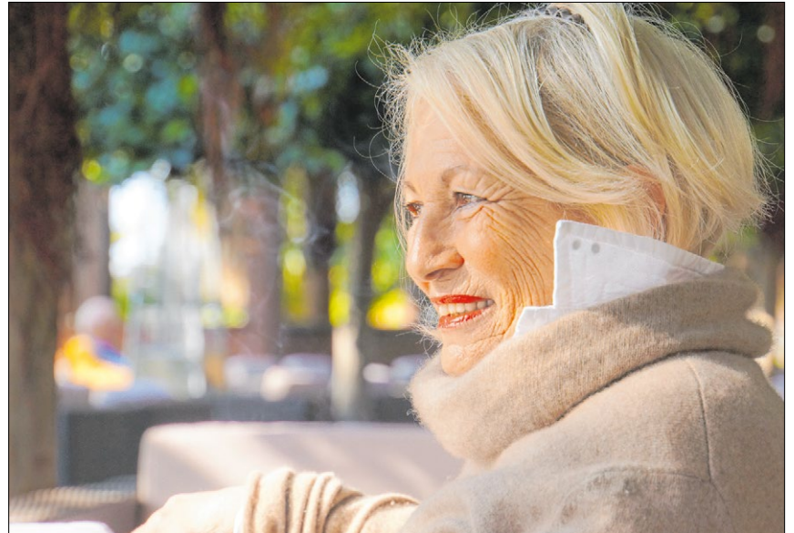
▲ Die Krebstherapie hat in den vergangenen Jahren große Fortschritte gemacht. Viele Patienten können deshalb optimistisch in die Zukunft blicken.