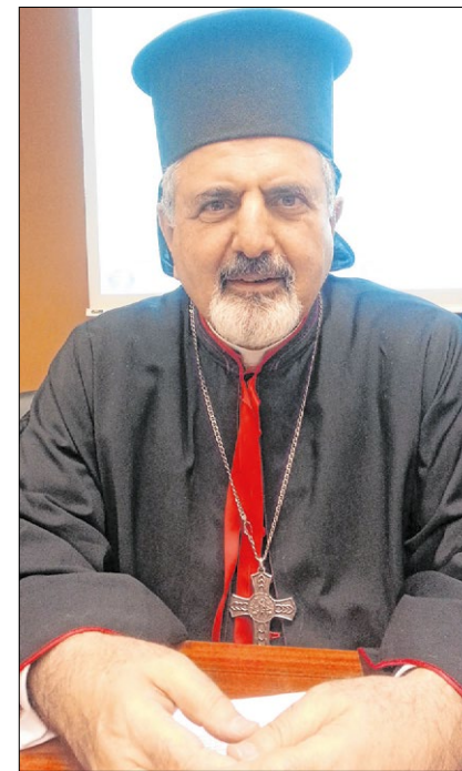
Der syrisch-katholische Patriarch Ignatius III. Joseph Younan. Er fordert ein Ende der europäischen Sanktionen gegen sein Land.

alle anderen.“ Es gehe darum, den Christen Syriens Gehör zu verschaffen. Der Patriarch rief die Vertreter der Hilfswerke deshalb dazu auf, dem syrischen Volk dabei zu helfen, sich von „Bevormundung, Günstlingswirtschaft und Profitmacherei“ zu befreien, sagte Younan. „Treten Sie bei Ihren Politikern und in den Medien für uns ein.“