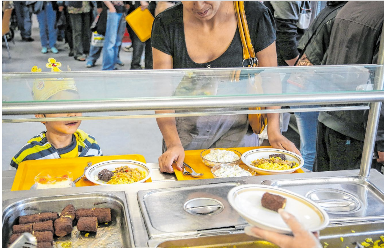
▲ Anstehen für eine warme Mahlzeit in einer Tafel. Armut gibt es auch im reichen Deutschland.

Wer in Deutschland mit Armut zu tun hat, kann schon mal eine Überraschung erleben