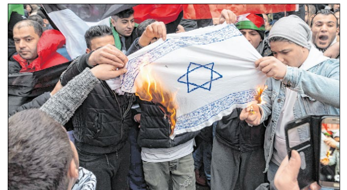
Demonstranten in Berlin verbrennen eine nachgemachte Israel-Flagge.

Der Koordinationsrat der Muslime (KRM) ging in einer Stellungnahme nicht eigens auf die anti-israelischen Demonstrationen ein, rief jedoch Muslime, Christen und Juden auf, für den Dialog einzutreten. KRM-Sprecher Zekeriya Altug verurteilte die Entscheidung der USA. Sie berge die Gefahr „die instabile Situation im Nahen und Mittleren Osten noch weiter zu schwächen“.