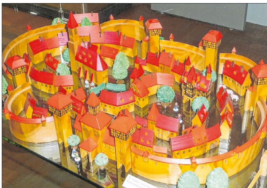
▲ Selbst komplette mittelalterliche Stadtanlagen aus Holz bauen die Seiffener Spielzeughersteller.